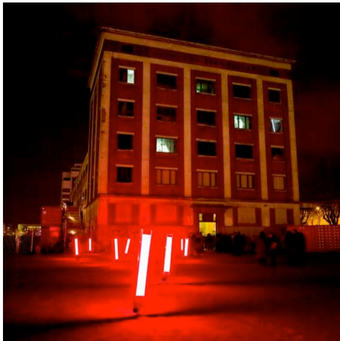
Môle Seegmuller, friche industrielle ouverte pour Ososphère.

Arts numériques. Durant dix jours, le festival réveille les friches de la presqu'île Malraux, future extension du centre de Strasbourg.