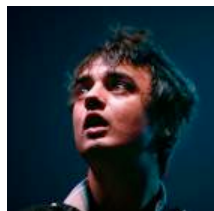
Pete Doherty soupçonné d'un vol de guitare