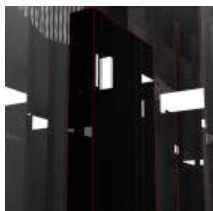
Vos coms sur Libé.fr, c'est de l'art