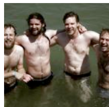
La Playlist: Akron/Family, Mogwai...