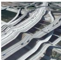
Google Earth plus fort que Dali?