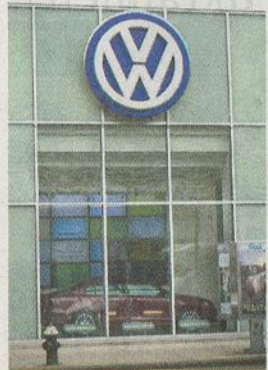
VISUAL PRESS AGENCY