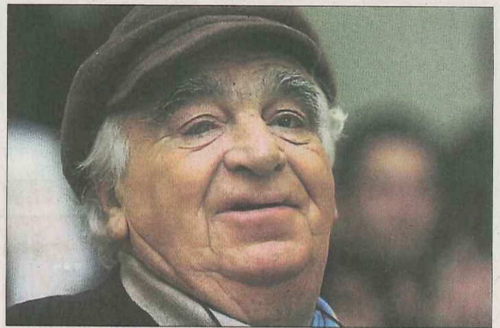
■ Le trompettiste Maurice André sera dans toutes les têtes.

Mémoire | De nombreux artistes réunis à Villefort dimanche à 17 h.