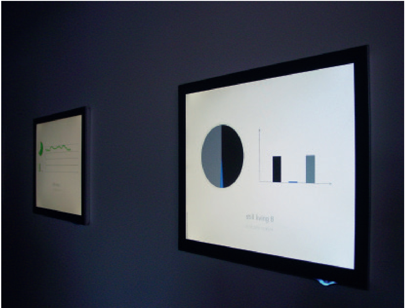
Fig. 2. Antoine Schmitt, Still living I , 2006, collection Espace multimédia Gantner, conseil général du Territoire de Belfort.