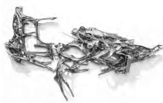
Sans titre Lee Bul, 2013.