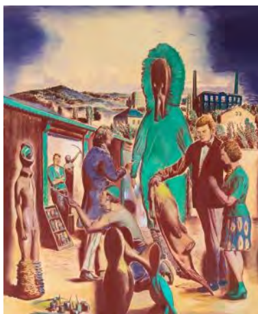
Das Bannende, huile sur toile Neo Rauch, 2013.

A quelques pas, se dresse le Grand Palais, et son extraordinaire verrière 1900, qui incarne la capitale presque autant que la Tour Eiffel. Vestige de l'ère des grandes expositions universelles, près du pont Alexandre III – symbole de l'amitié franco-russe depuis 1893 –, il continue d'accueillir tous les prestiges. A la Fiac, la peinture contemporaine est omniprésente. Elle y est essentiellement figurative. On note, dans ce domaine, le stand de la galerie allemande Eigen + Art (Berlin, Leipzig) qui présente Neo Rauch (né en 1960) et Marc Desgrandchamps (né en 1960), entre autres. Les compositions sont impressionnantes, en taille, comme en qualité. Il ne s'agit pas de proposer des tableaux signés par des grands noms, mais bien des œuvres picturales.