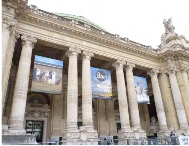
Le Grand Palais.

De l'incontournable Fiac à la longue allée d' Art Elysées , en passant par les entrées multiples de la Yia ou encore l'inédite Outsider Art Fair , le cru 2013 de la semaine de l'art contemporain parisienne est dense et tient ses promesses. En voici un aperçu parsemé de quelques éclairages-coups de cœur.